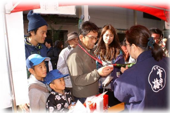
【越後・謙信 SAKE まつりの様子】

□お問い合わせ・申込み先 越後・謙信 SAKE まつり実行委員会 (事務局：上越市産業振興課内) TEL:025-526-5111 FAX:025-526-6113 E-mail : chukatsu@city.joetsu.lg.jp